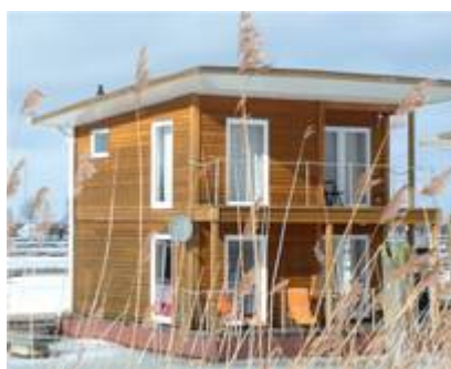
...auch im Winter sehr gemütlich...