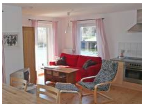
Wohnzimmer in der unteren Etage

Gerne können Sie zusätzlich zu Ihrem FLOATING HOUSE ein Boot oder Fahrrad mieten, oder eine Tagesfahrt mit einem Traditionssegler unternehmen. Bitte reservieren Sie rechtzeitig. Informationen über offene Motorboote, Tagesfahrten und weitere Angebote finden Sie auf unserer Internet-Seite.