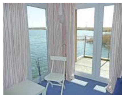
Offene Galerie in der oberen Etage