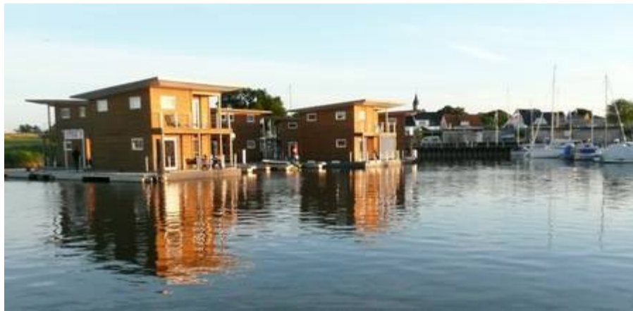
FLOATING HOUSES in Kröslin

Der besondere Urlaub auf dem Wasser: FLOATING HOUSES - Comfort in Kröslin