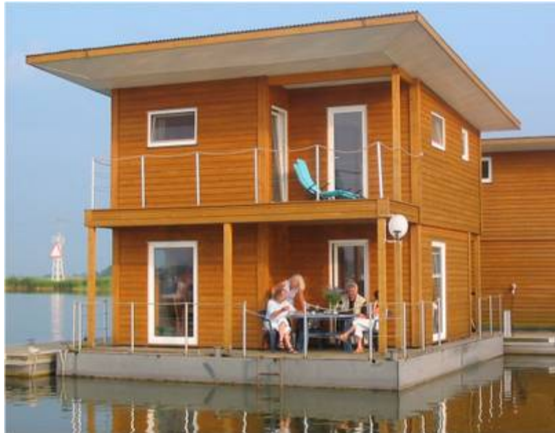
FLOATING HOUSE Typ classic in Kröslin

Die FLOATING HOUSES bieten ein einmaliges Wohnerlebnis: